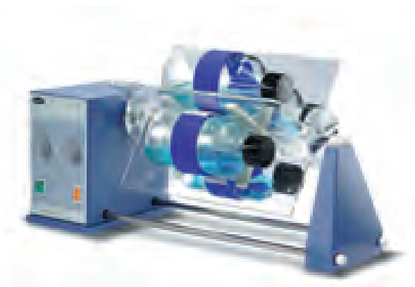
STR4 加 STR4/4