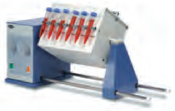
STR4 加 STR4/1