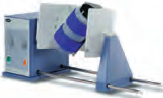
STR4 加 STR4/3