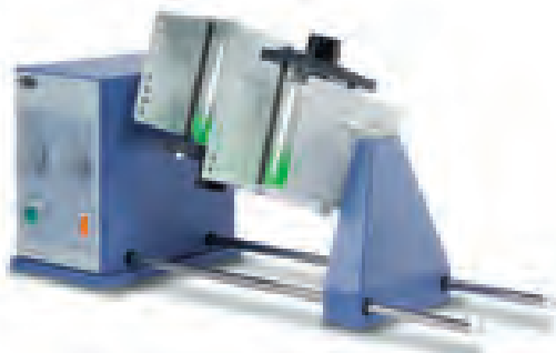
STR4 加 STR4/2