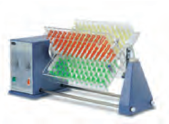
STR4 加 STR4/5